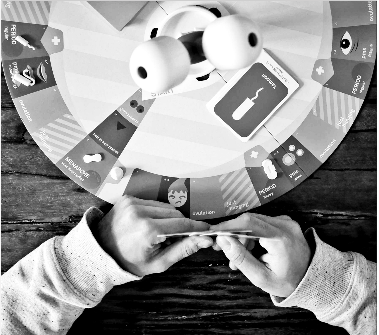
THE PERIOD GAME : comprendre la puberté par le jeu.