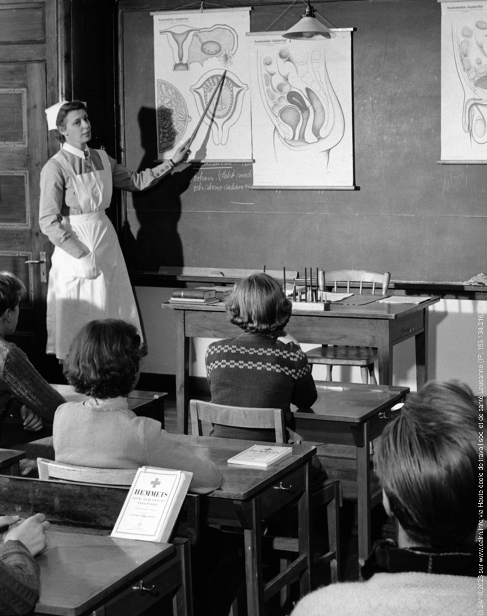
L'ÉDUCATION SEXUELLE à l'école dans les années 1950 (Suède).