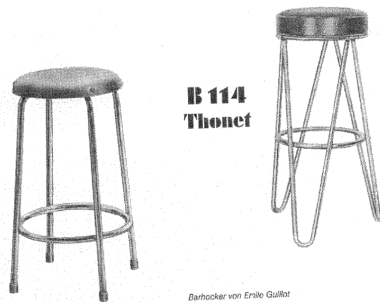
B 114 Thonet