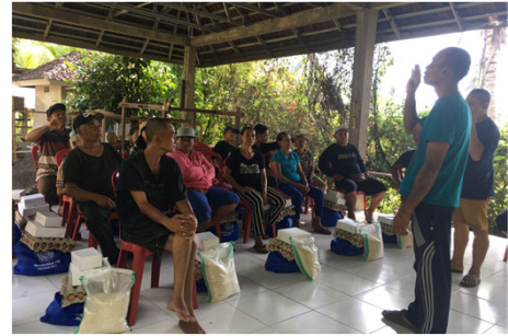
Distribution de nourriture par une ONG locale