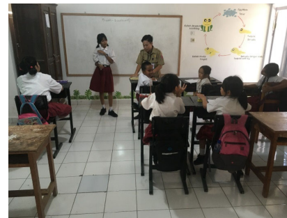
La classe pour  l ves sourd-es