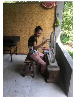
Une tisserande de l'atelier