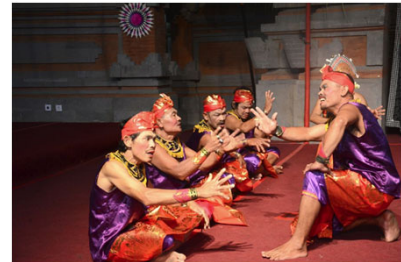
Le groupe de danse kolok https://thesmartlocal.com/images/easyblog_articles/5195/Bengkala-Village-Theatre.jpg