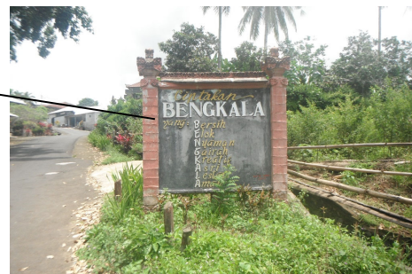
Desa Kolok (village sound)