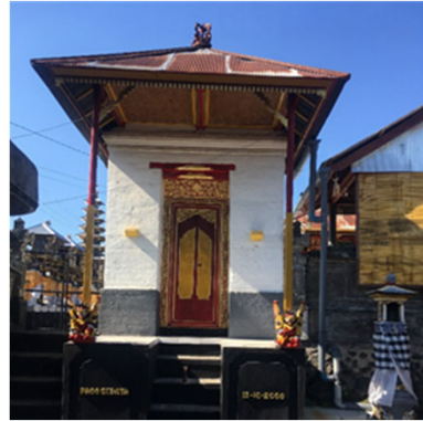
Un temple clanique de Bengkala