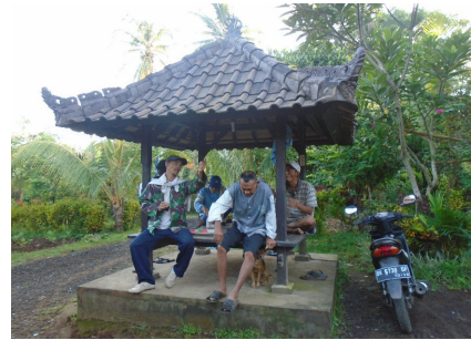
Bale begong – photovoice (Ngarda)

Risque d'idéalisation occidentalo-centrée