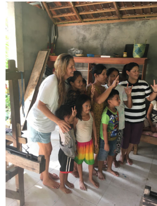
Visite de touristes à l'atelier de tissage