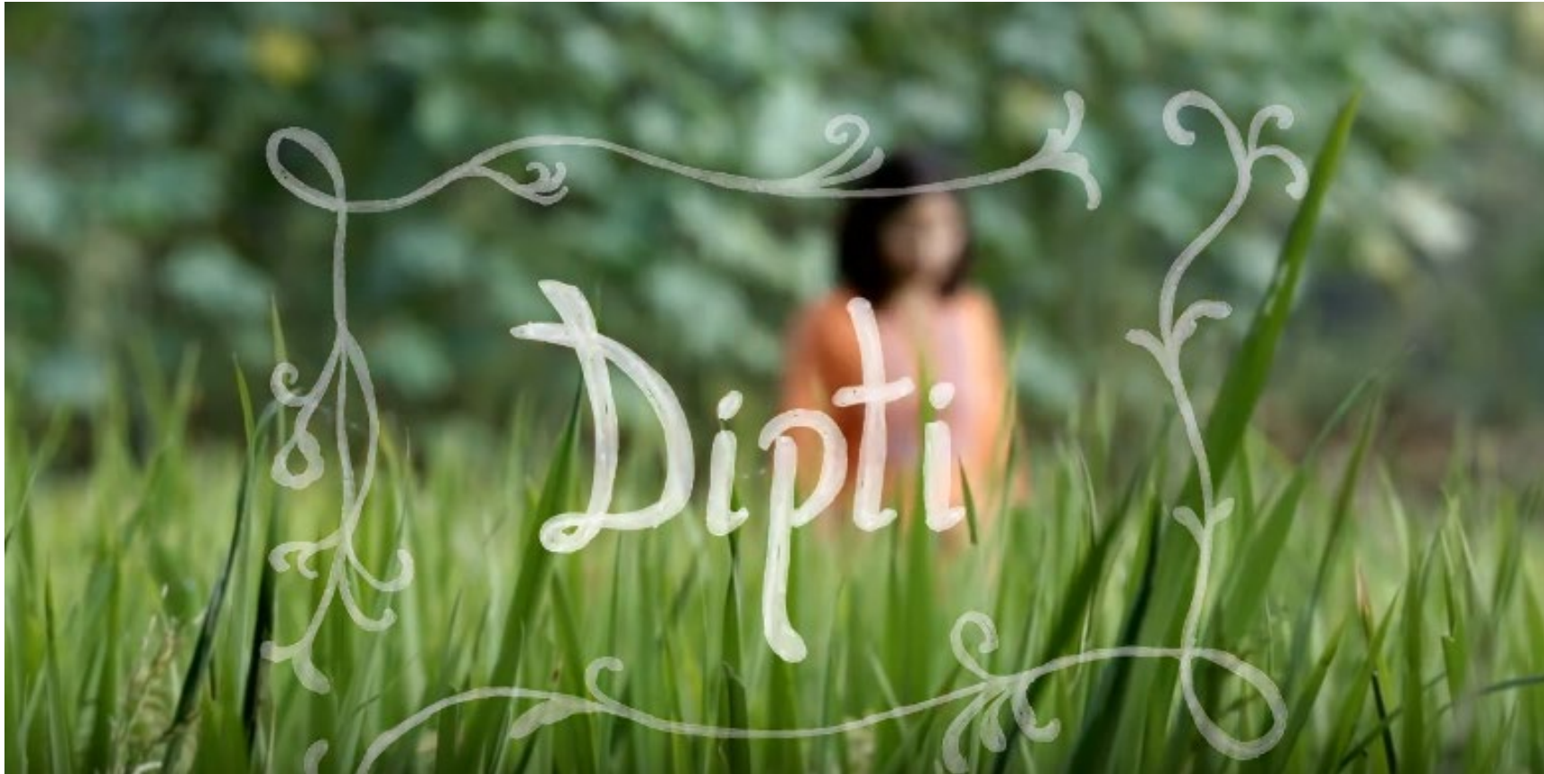
IKEA HEMTRAKT - Dipti's story