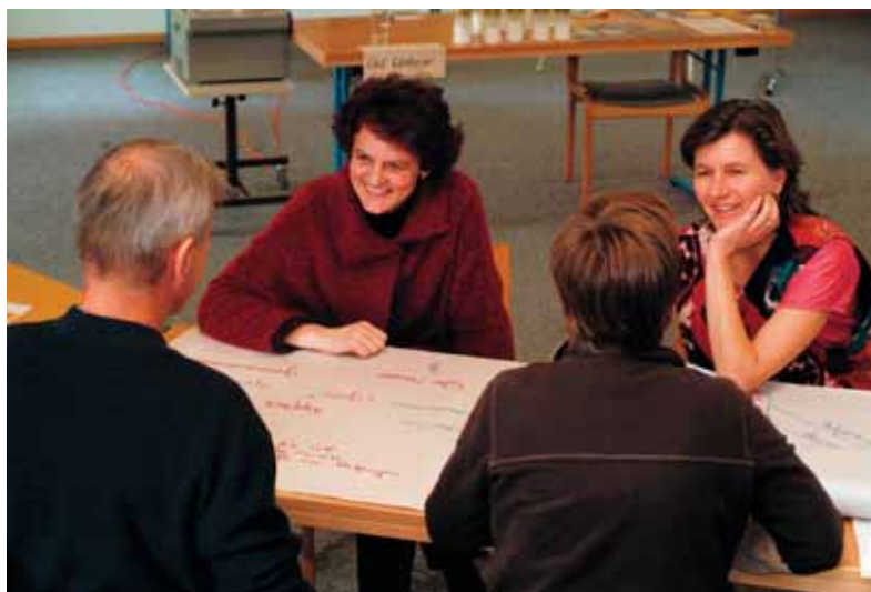
Marcel Kaufmann / bmi-bild.ch