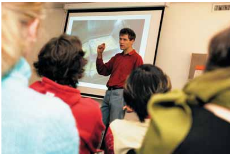
Marcel Kaufmann / bmi-bild.ch