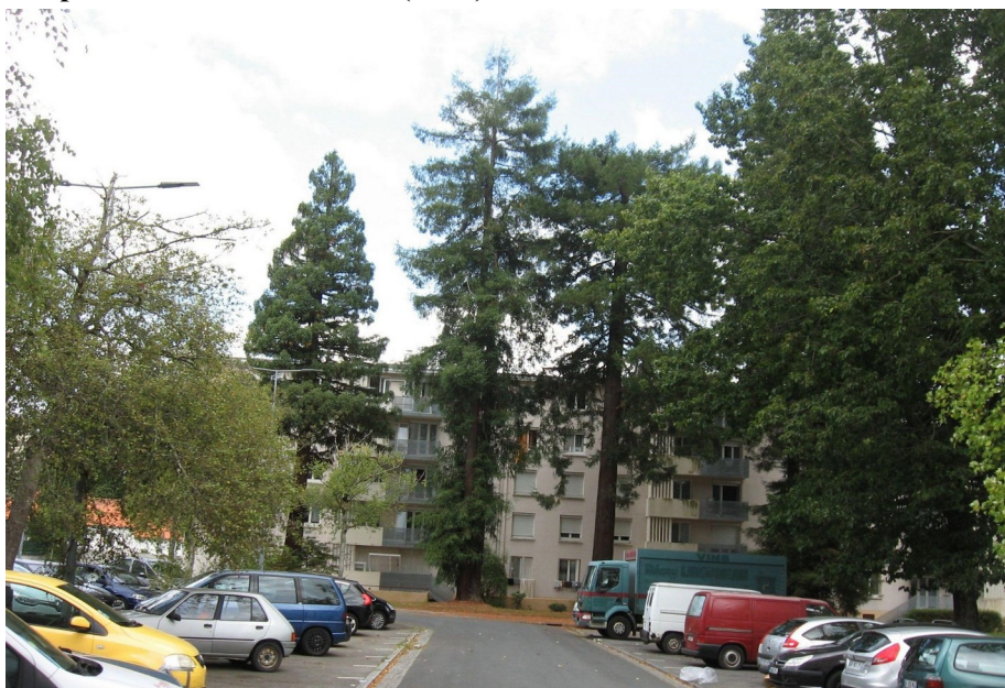
Figure 3. Un riche patrimoine végétal mais des aménagements parfois de faible qualité - Séquoia sempervirens à La Boissière (2019)

Des aspects qualitatifs sont aussi soulignés. À Nantes Nord, des héritages du paysage bocager – haies, anciens arbres têtards – ont été préservés et aménagés. Les espaces verts associés aux grands ensembles ont, quant à eux, fait l'objet d'aménagements importants – plantations (figure 3) et équipements – entrepris par la municipalité avec l'appui des services de l'État dès les années 1980 (figure 4). La présence d'espaces verts est vue comme un avantage à la lumière des connaissances sur les « services écosystémiques », c'est-à-dire la reconnaissance des bénéfices que les humains retirent des écosystèmes (MEA 2005), rendus par la nature en ville (Bolund et Hunhammar 1999 ; Dearborn et Karks 2010). On peut estimer que ces espaces verts apportent déjà des bénéfices en matière de biodiversité, de confort thermique ou d'esthétique.