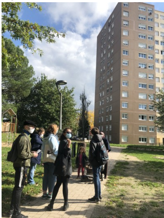
Figure 5. Visite de la « boucle verte » avec un groupe d'habitants

gestion, afin de mieux prendre en compte le moyen et le long terme. De fait, les SfN questionnent ainsi tout autant les conditions matérielles des aménagements que le processus d'intervention.