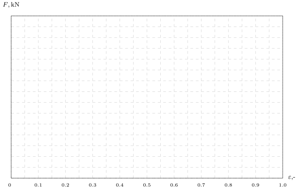
FIGURE 2 – Charge en fonction de la déformation